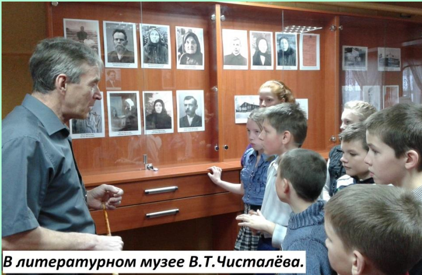
В литературном музее В.Т.Чисталёва.