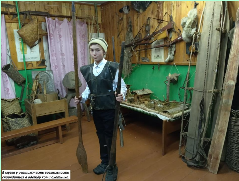
В музее у учащихся есть возможность снарядиться в одежду коми охотника.